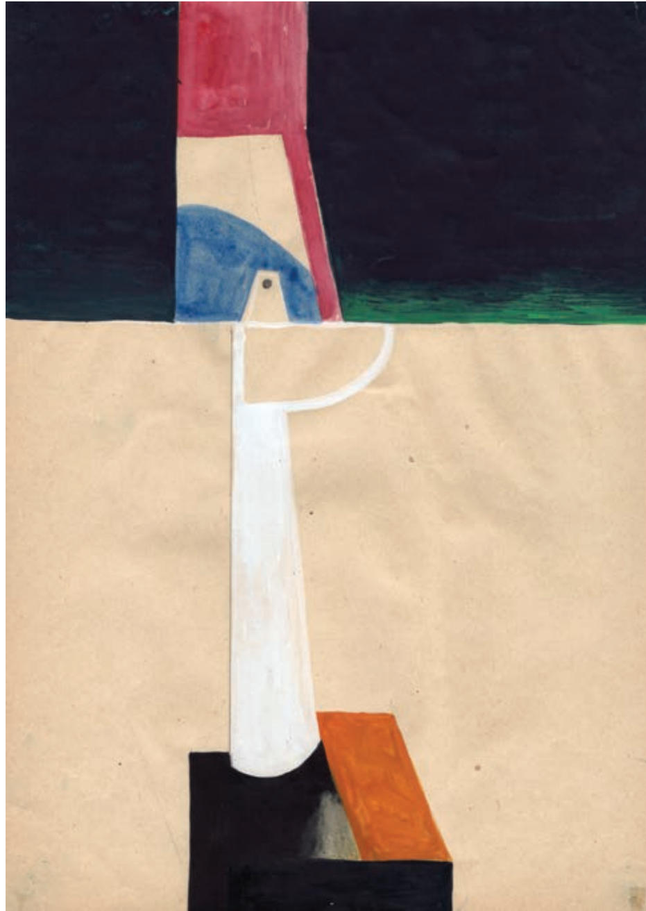
Bez tytułu, gwasz na papierze, 29,7 x 21 cm, 2012