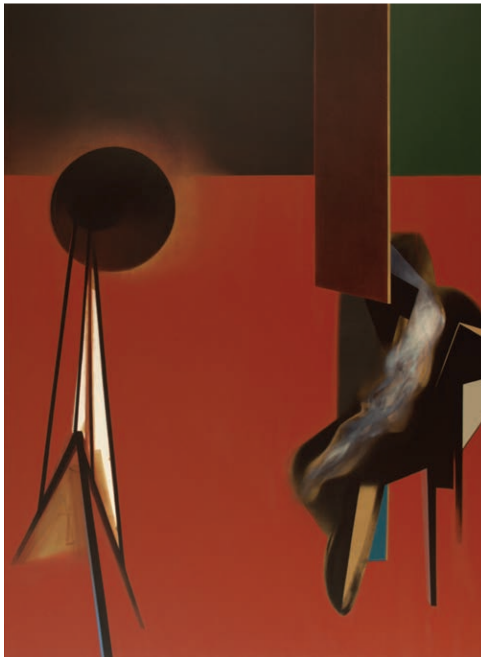
„Medium” z cyklu „Materializacje”, olej na płótnie, 190 x 140 cm