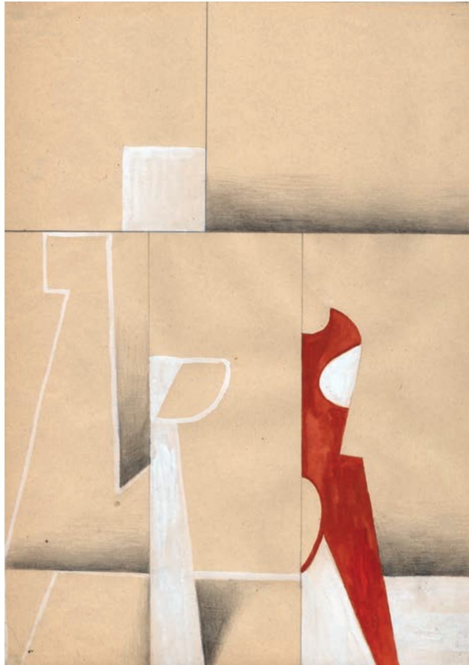
Bez tytułu, gwasz na papierze, 29,7 x 21 cm, 2012