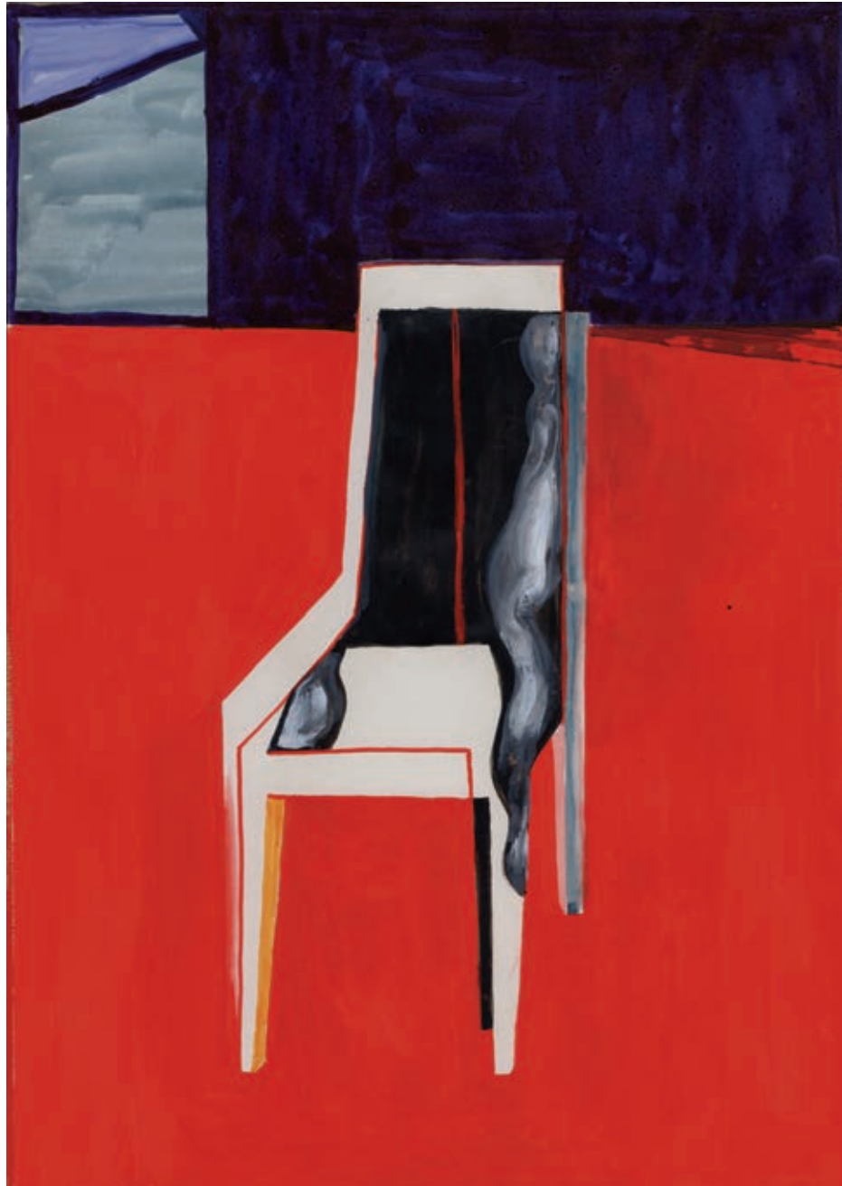
„Materializacja”, gwasz na papierze, 29,7 x 21 cm, 2014