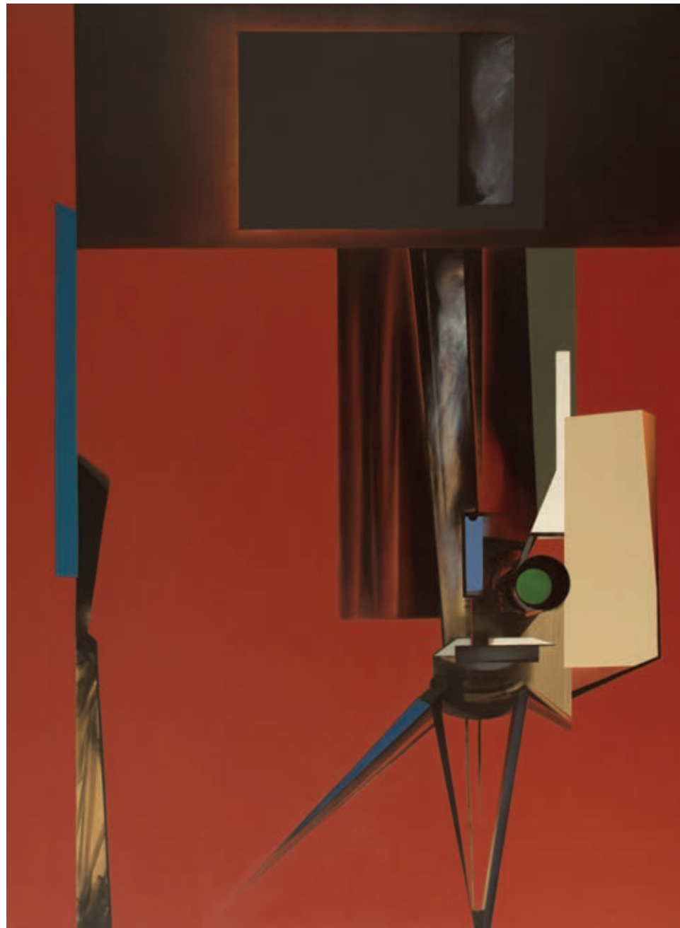
„Projekcja” z cyklu „Materializacje”, olej na płótnie, 190 x 140 cm