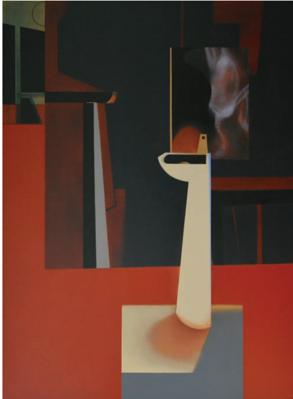
„Preparat” z cyklu „Materializacje”, olej na płótnie, 190 x 140 cm