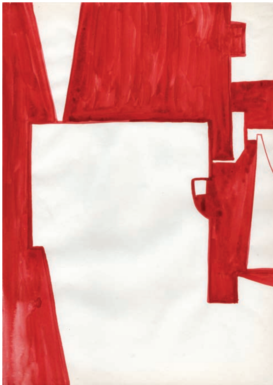
Bez tytułu, akwarela na papierze, 29,7 x 21 cm, 2013