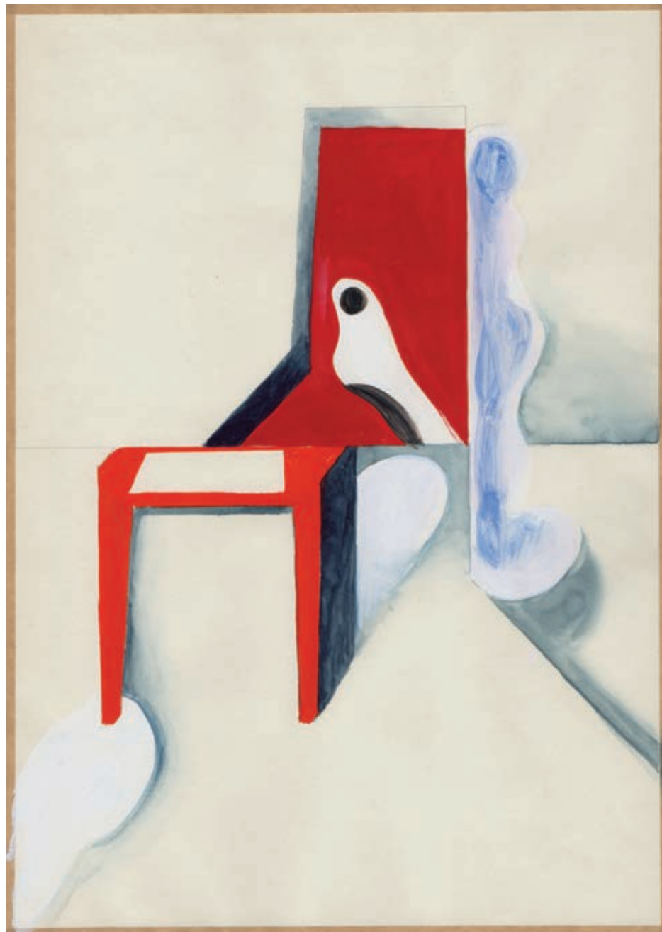
„Materializacje”, gwasz na papierze, 29,7 x 21 cm, 2014