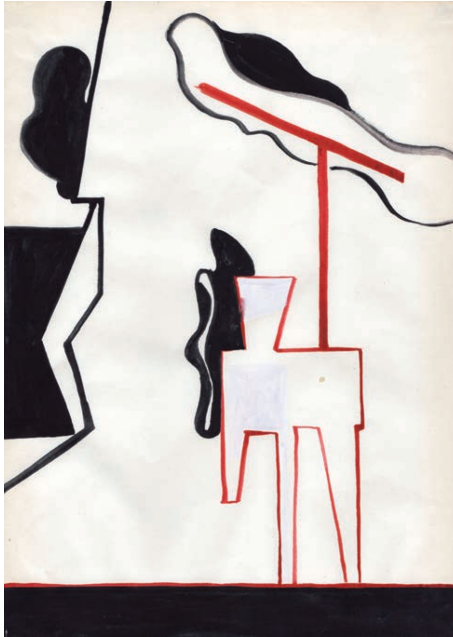
Bez tytułu, akwarela na papierze, 29,7 x 21 cm, 2013