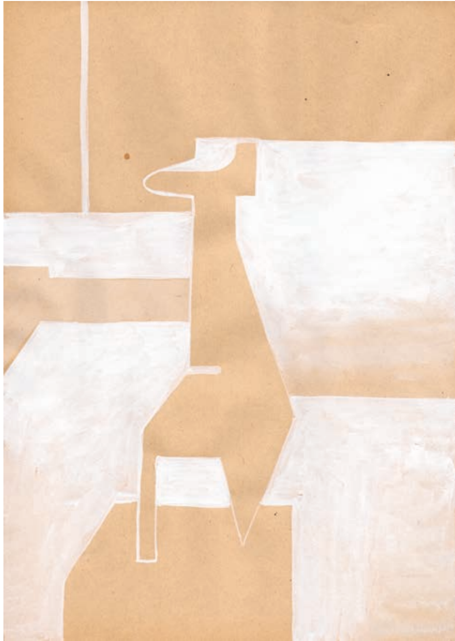
„Nieme znaczenia”, gwasz na papierze, 29,7 x 21 cm, 2012