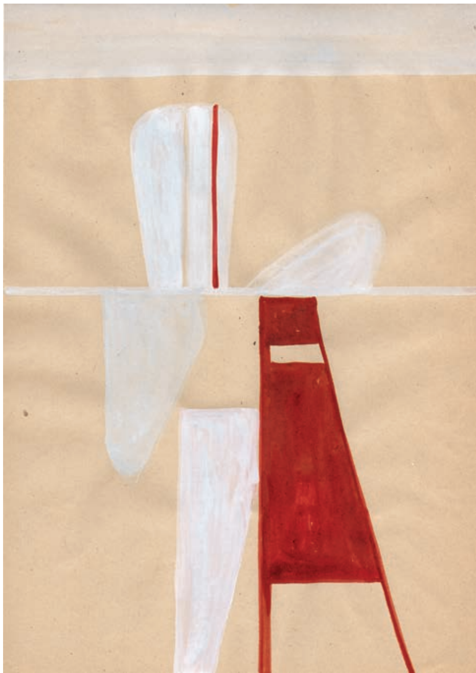
„Nieme znaczenia”, gwasz na papierze, 29,7 x 21 cm, 2012