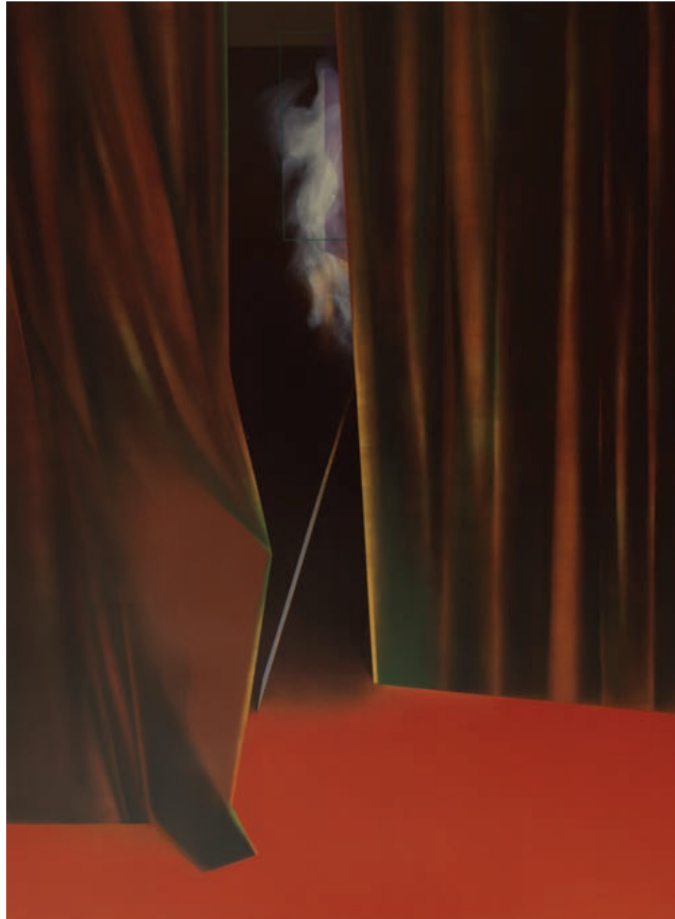
„Zasłona” z cyklu „Materializacje”, olej na płótnie, 190 x 140 cm