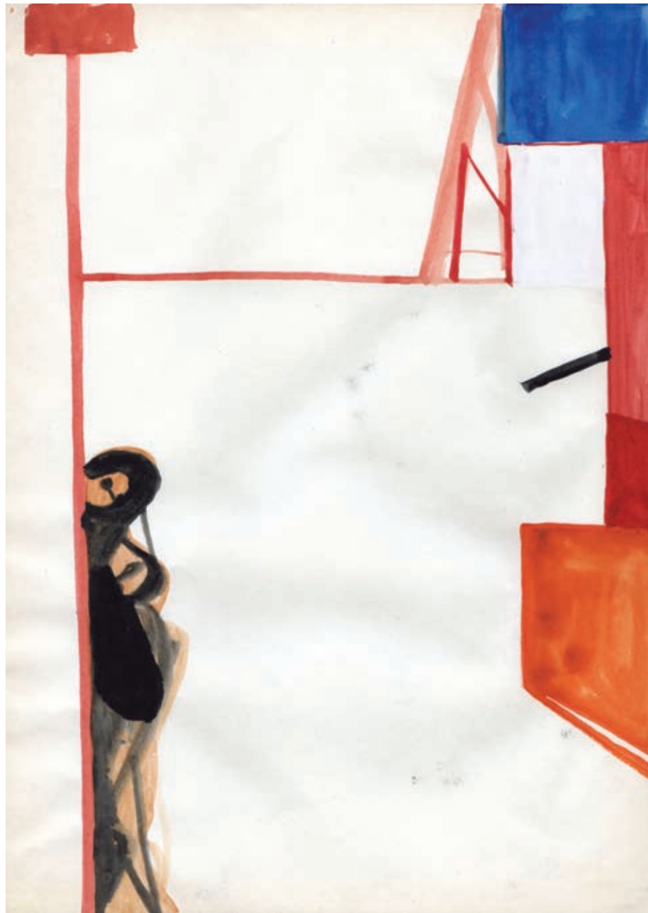
Bez tytułu, akwarela na papierze, 29,7 x 21 cm, 2013