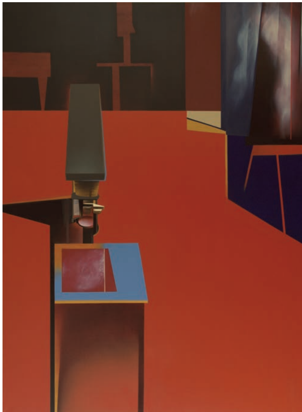
„Powiększenie” z cyklu „Materializacje”, olej na płótnie, 190 x 140 cm