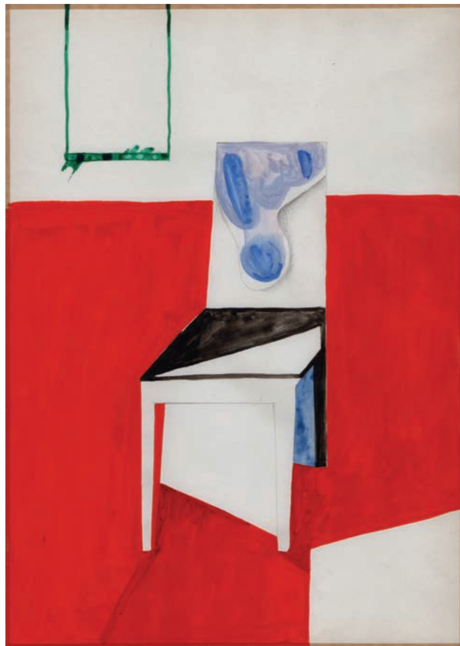
„Materializacje”, gwasz na papierze, 29,7 x 21 cm, 2014