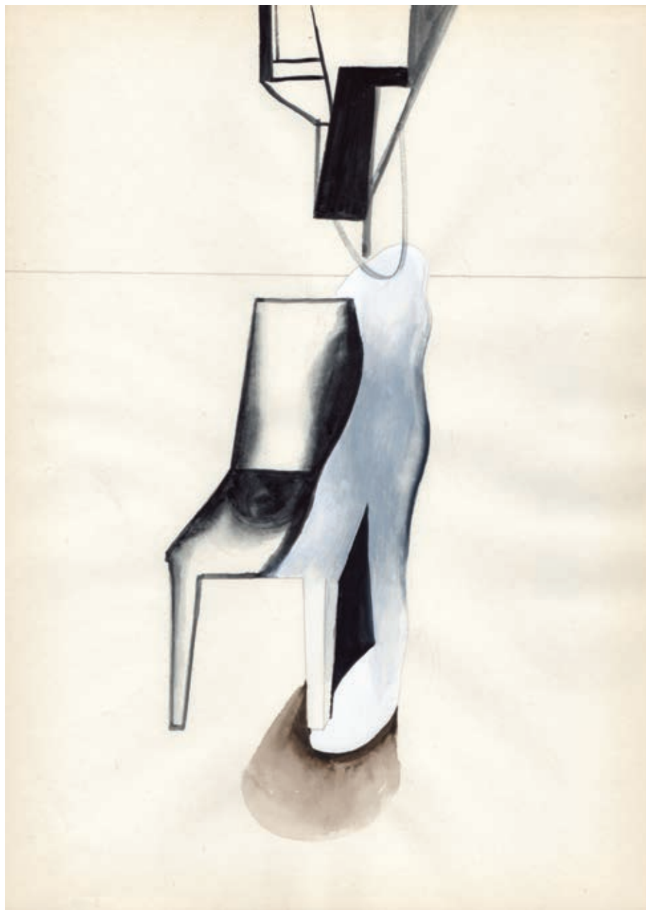
„Widmo”, gwasz na papierze, 29,7 x 21 cm, 2014